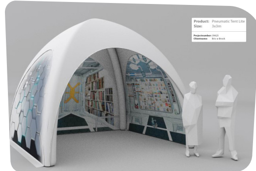
Figuur 2: Voorbeeld van een tent