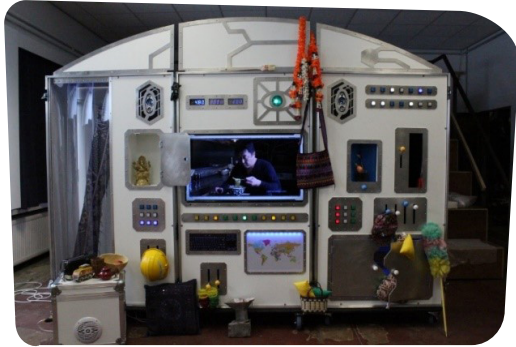
Figuur 1: Bedieningspaneel bestaande uit 3 delen

De opstelling van het ruimteschip bestaat uit 3 opblaasbare tenten, een middenstuk en een bedieningspaneel. Om dit decor te kunnen opzetten, is er minstens een ruimte nodig van 9 x 10 m en 2,5 m hoog. Omdat het decor waardevolle elementen bevat, vragen wij om de mogelijkheid om het lokaal af te sluiten.