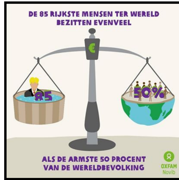
Inkomens ..... (GINI-coëfficiënt)